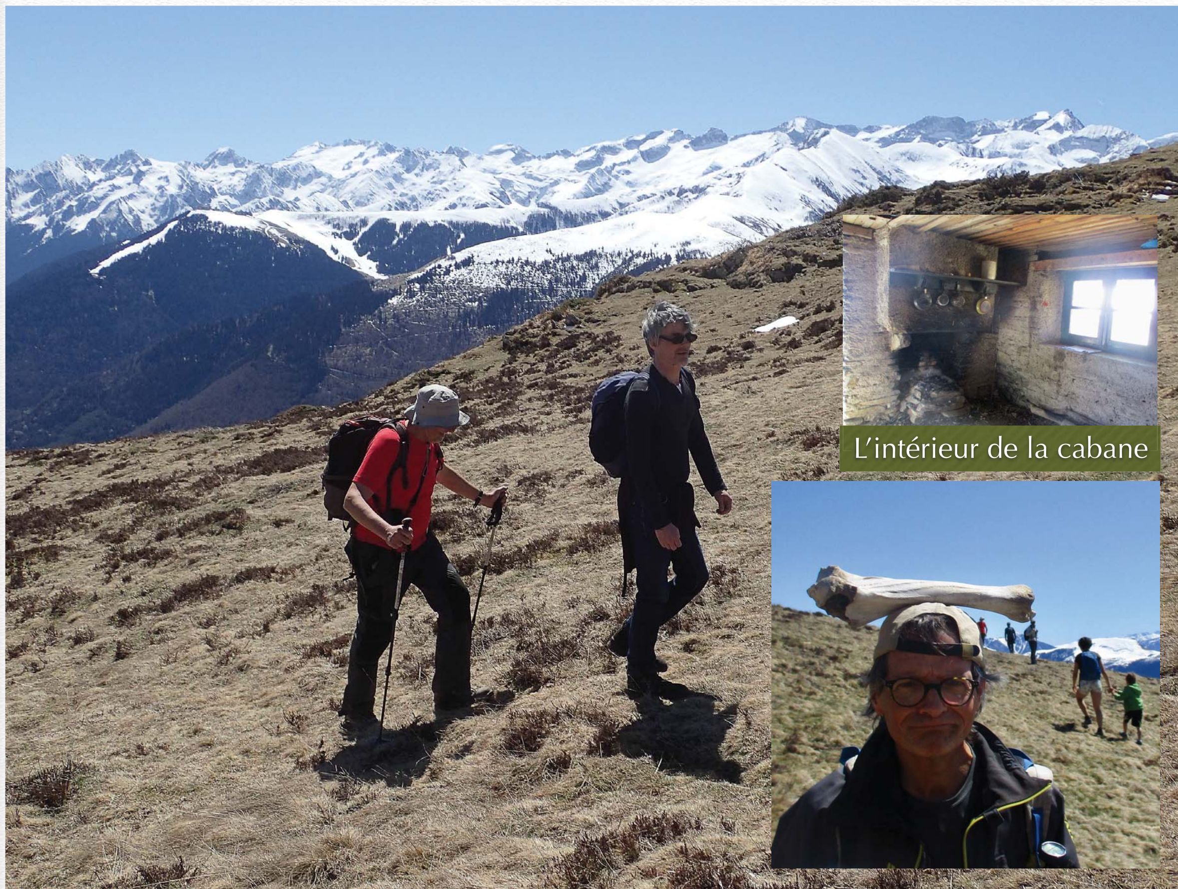
L'intérieur de la cabane

L'initiateur rando se transforme en homme paléo l'espace d'un instant